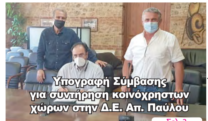
Υπογραφή Σύμβασης για συντήρηση κοινόχρηστων χώρων στην Δ.Ε. Απ. Παύλου