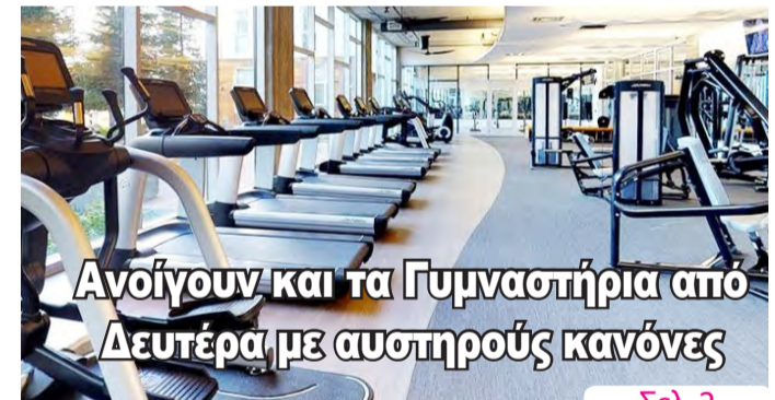
Ανοίγουν και τα Γυμναστήρια από Δευτέρα με αυστηρούς κανόνες