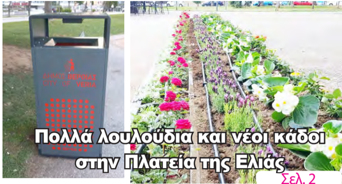
Πολλά λουλούδια και νέοι κάδοι στην Πλατεία της Ελιάς