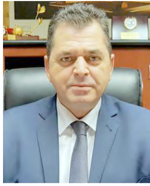
Για τις ζημιές από το χαλάζι στην Ημαθία ενημέρωσε ο Αντιπεριφερειάρχης τον πρόεδρο του ΕΛΓΑ