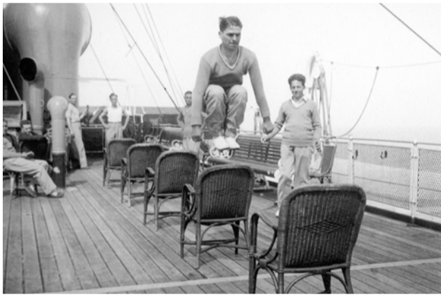
Προπόνηση της εθνικής Γαλλίας στο κατάστρωμα και εν πλω προς Ουρουγουάη

Η σέντρα του πρώτου παγκόσμιου κυπέλλου ορίστηκε για τις 13 Ιουλίου του 1930 στο Μοντεβιδέο, την πρωτεύουσα της διοργανώτριας χώρας. Έτσι σχεδόν ένα 20ήμερο πριν, στις 21 Ιουνίου της ίδιας χρονιάς, η Εθνική Ρουμανίας αφού ταξίδεψε σιδηροδρομικά μέχρι την Ιταλία, απέπλευσε με το ιταλικό ατμόπλοιο Conte Verde από τη Γένοβα. Ακολούθησε μια πρώτη στάση στο Βιλφράνς ντε Μερ όπου επιβίβαστηκε η εθνική Γαλλίας. Επόμενη στάση ήταν η Βαρκελώνη όπου το πλοίο παρέλαβε την Εθνική Βελγίου και μετά διασχίζοντας τον Ατλαντικό, «έπιασε» λιμάνι απέναντι, στο Ρίο ντε Τζανέιρο της Βραζιλίας. Εκεί παρέλαβε την εθνική Βραζιλίας και στις 4 Ιουλίου 1930 κατέπλευσε στο Μοντεβιδέο της Ουρουγουάης.