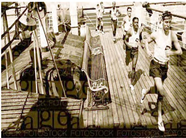
Προπόνηση στο κατάστρωμα για την Εθνική Βραζιλίας πριν την άφιξη στην Ουρουγουάη

Η Αίγυπτος αποδέχθηκε την πρόσκληση συμμετοχής στο πρώτο παγκόσμιο κύπελλο η Αίγυπτος, κάπως αργοπορημένα. Η αργοπορία της Αιγύπτου συνέπεσε με την «άλλη» αργοπορία των Γιουγκοσλάβων οπότε οι δύο εθνικές κανόνισαν να ταξιδέψουν στο Μοντεβιδέο, με το ίδιο πλοίο από τη Μασσαλία.