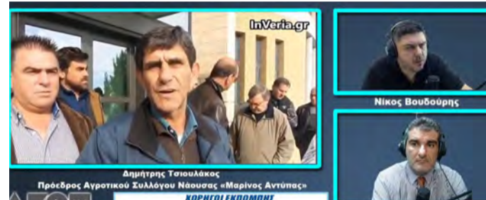
«Ζεσταίνουν» τα τρακτέρ για τον Οκτώβριο