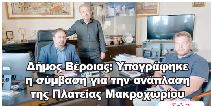
Δήμος Βέροιας: Υπογράφηκε η σύμβαση για την ανάπλαση της Πλατείας Μακροχωρίου