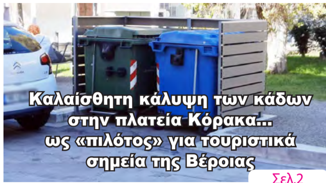
Καλαίσθητη κάλυψη των κάδων στην πλατεία Κόρακα... ως «πιλότος» για τουριστικά σημεία της Βέροιας