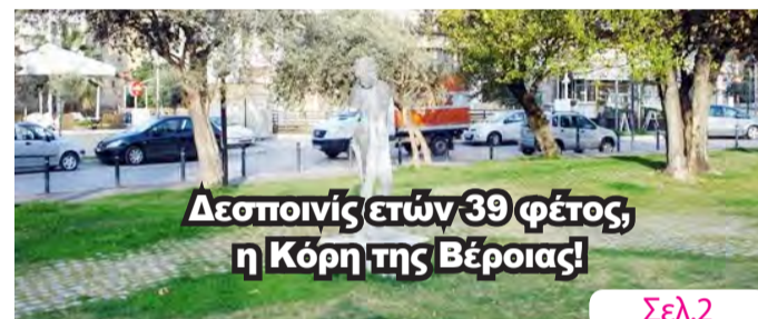
Δεσποινίς ετών 39 φέτος, η Κόρη της Βέροιας!