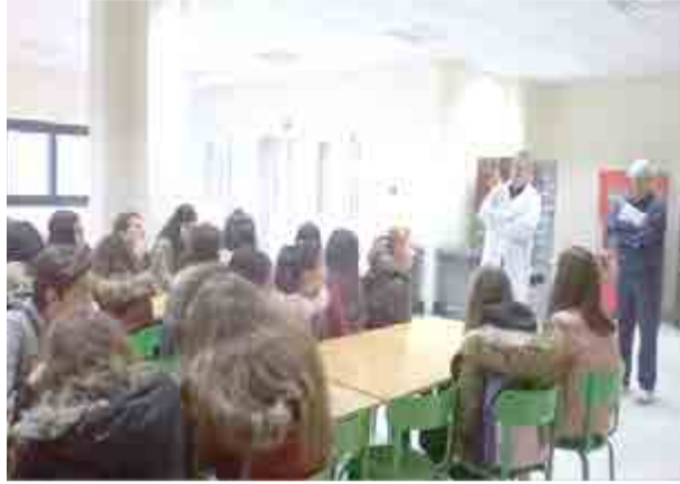
Επίσκεψη στο εργοστάσιο Χυμών ASPIS στο Ζερβοχώρι