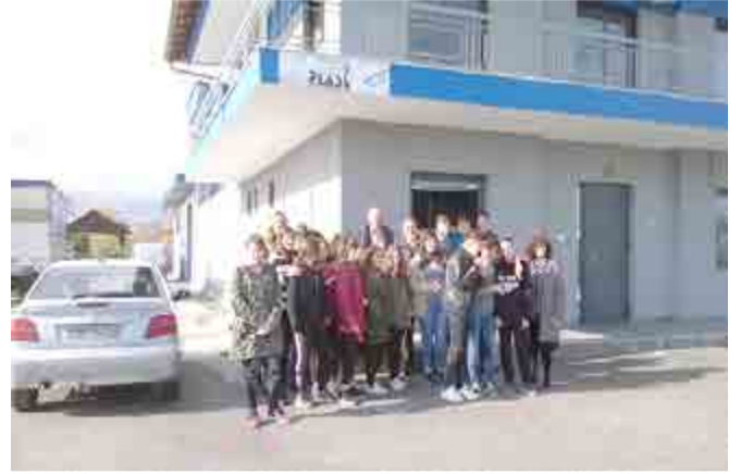
Επίσκεψη στο εργοστάσιο πλαστικής σακούλας Superplast

Σκοπός της επίσκεψης υπήρξε η βιωματική επαφή των μαθητών με το βιομηχανικό σύστημα και τη γραμμική παραγωγή. Ως πρώτος σταθμός της επίσκεψης ορίστηκε το εργοστάσιο παρασκευής και συσκευασίας χυμών ASPIS με έδρα το Ζερβοχώρι. Οι μαθητές ξεναγήθηκαν στις υπάρχουσες εργοστασιακές εγκαταστάσεις και παρακολούθησαν τα διάφορα στάδια παραγωγής και αποθήκευσης του χυμού. Εξαιρετική στην ολοκλήρωση της ξενάγησης ήταν η συμβολή του Διευθυντή κυρίου