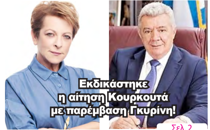
Εκδικάστηκε η αίτηση Κουρκουτά με παρέμβαση Γκυρίνη!