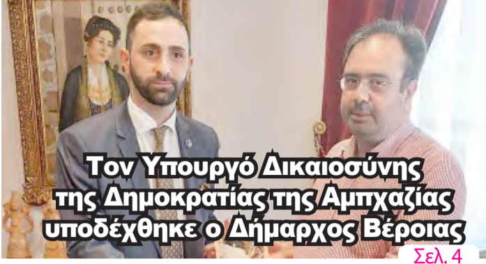
Τον Υπουργό Δικαιοσύνης της Δημοκρατίας της Αρμπζίας υποδέχθηκε ο Δήμαρχος Βέροιας