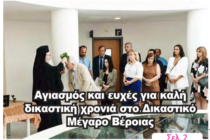
Αγιασμός και ευχές για καλή δικαστική χρονιά στο Δικαστικό Μέγαρο Βέροιας