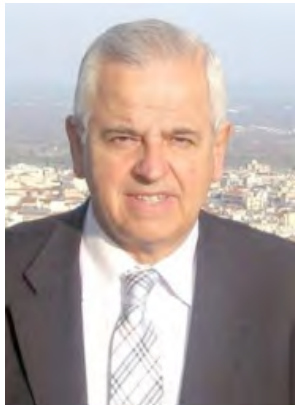
Γράφει ο Αναστάσιος Βασιλάδης

Η τρέχουσα προεκλογική επικαιρότητα και τα ζέοντα ζητήματα της εγχώριας αλλά και της διεθνούς πολιτικής σκηνής, είχαν ως αποτέλεσμα να περάσει υποτονικά η Παγκόσμια Ημέρα Υγείας, η οποία καθιερώθηκε να τιμάται από τον Παγκόσμιο Οργανισμό Υγείας, στις 7 Απριλίου.