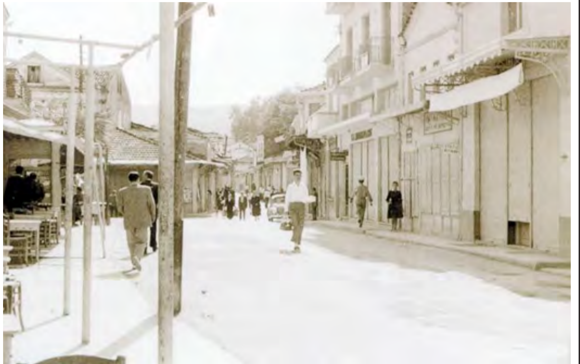
Οδός Κεντρικής, αν και πέρασαν πολλά χρόνια από την στιγμή της φωτογραφίας, κάποια κτίρια παραμένουν τα ίδια στο πέρασμα του χρόνου