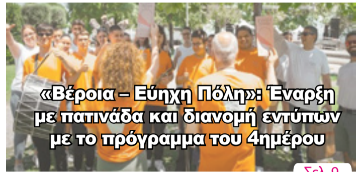
«Βέροια – Εύχη Πόλη»: Έναρξη με πατινάδα και διανομή εντύπων με το πρόγραμμα του 4ημέρου