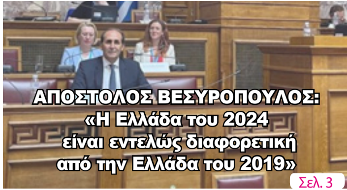
ΑΠΟΣΤΟΛΟΣ ΒΕΣΥΡΟΠΟΥΛΟΣ: «Η Ελλάδα του 2024 είναι εντελώς διαφορετική από την Ελλάδα του 2019»