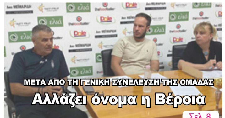
ΜΕΤΑ ΑΠΟ ΤΗ ΓΕΝΙΚΗ ΣΥΝΕΛΕΥΣΗ ΤΗΣ ΟΜΑΔΑΣ Αλλάζει όνομα η Βέροια