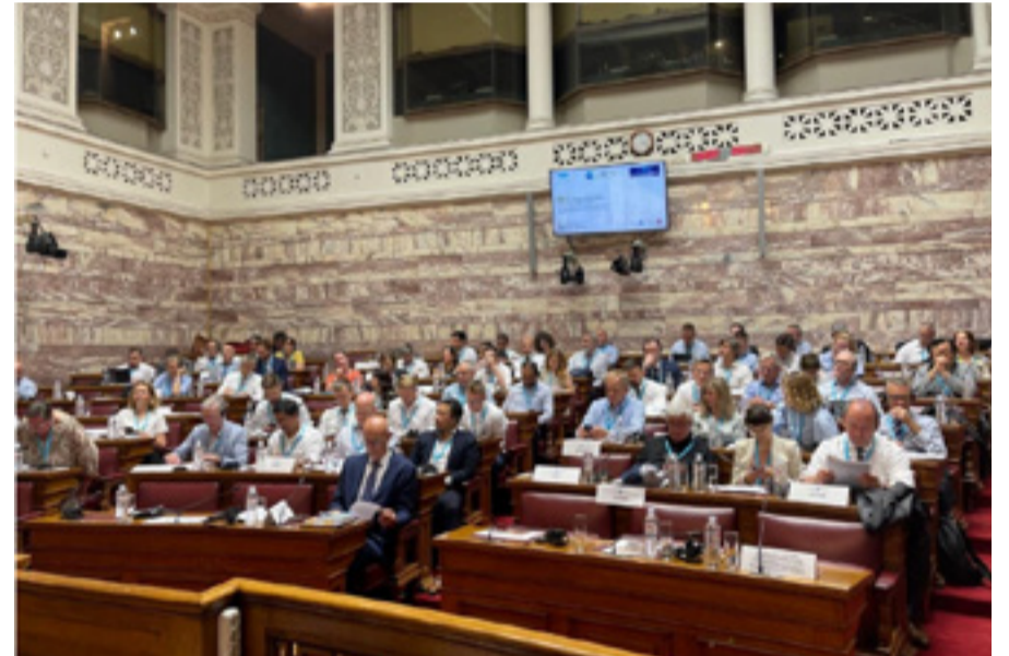
της Βουλής των Ελλήνων, εκφράζοντας την πεποίθησή του για την επιτυχία των εργασιών του συνεδρίου.