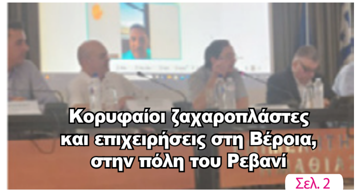
Κορυφαίοι ζαχαροπλάστες και επιχειρήσεις στη Βέροια, στην πόλη του Ρεβανί