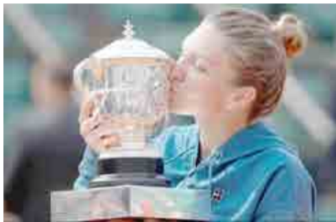
Η Σιμόνα Χάλεπ φιλάει το κύπελλο που κέρδισε στο τουρνουά του Ρολάν Γκαρός

Μετά από δύο ανεπιτυχείς τελικούς σε επίπεδο Grand Slam, η τενίστρια από τη Ρουμανία Σιμόνα Χάλεπ κατάφερε να πανηγυρίσει τον πρώτο μέγιστο τίτλο της καριέρας της, κατακτώντας το φετινό Roland Garros στο Παρίσι κερδίζοντας την Αμερικανίδα Σλόαν Στίβενς.