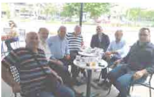
Ο πατέρας της Σιμόνα Χάλεπ, τρίτος από αριστερά (όπως βλέπουμε), στη Βέροια, με μέλη του Συλλόγου Βλάχων Βέροιας, μετά το Αντάμωμα Βλάχων στη Λάρισα (Ιούνιος 2017)

Τσίρη Γιώργο, η θριαμβεύτρια του γαλλικού τουρνουά Σιμόνα Χάλεπ (Simona Halep), κόρη του Στέριου και της Τάνας, έχει καταγωγή βλάχικη. Οι παπούδες της και από τις δύο πλευρές, με απώτερη καταγωγή τη Γράμμουστα, γεννήθηκαν στο Σοχό, έξω από τη Θεσσαλονίκη, και μετοίκησαν στη Ρουμανία την εποχή των εθνικιστικών παροξυσμών και των δημογραφικών ανακαταξενών στα Βαλκάνια τη δεκαετία του 1930.