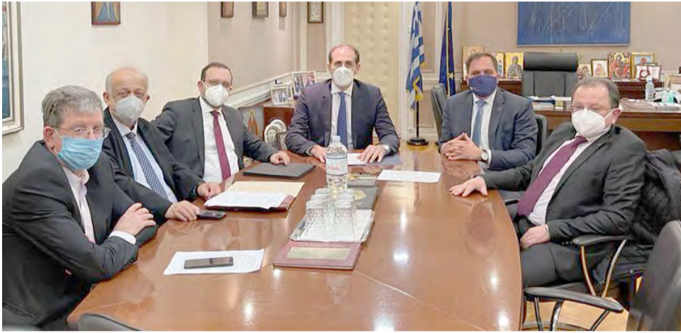
Το κρίσιμο θέμα της κατάργησης των ορίων των ακαθάριστων εσόδων των επιχειρήσεων