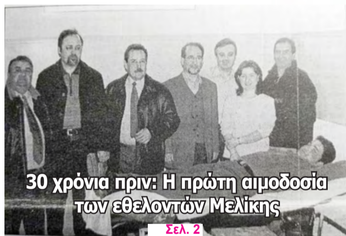
30 χρόνια πριν: Η πρώτη αιμοδοσία των εθελοντών Μελίκης Σελ. 2