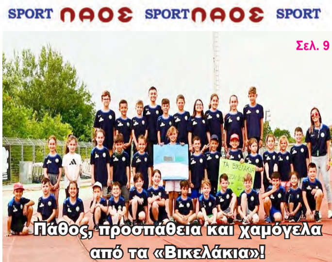
Πάθος, προσπάθεια και χαμόγελα από τα «Βικελάκια»! Σελ. 9