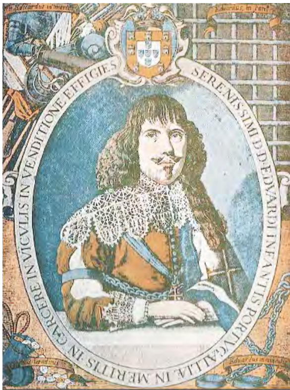
Ο Duarte de Braganca. Προς τιμή του, το 1649, κηρύχθηκε εθνικό πένθος για πρώτη φορά στην ιστορία

ση πένθους για τον θάνατο του πρωθυπουργού Ιωάννη Κωλέττη στις 31 Αυγούστου 1847. Ήταν μια απόφαση του βασιλιά Όθωνα, ο οποίος σε ένδειξη εθνικού πένθους υπέγραψε διάταγμα «πενθημέρου πενθοφορήσεως» των στρατιωτικών και των δημοσίων υπαλλήλων της χώρας.