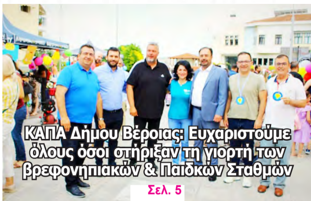
ΚΑΠΑ Δήμου Βέροιας: Ευχαριστούμε όλους όσοι στήριξαν τη γιορτή των βρεφονηπιακών & παιδικών Σταθμών Σελ. 5

Εθνικό Πένθος: Πρώτη φορά το έτος 1649 κι έκτοτε αναλόγως των προσώπων Σελ. 6