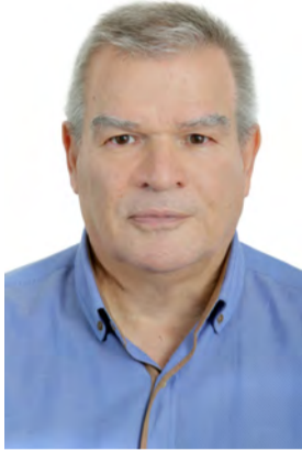
Του Χρήστου Μπλατισιώτη

Το Εθνικό Πένθος είναι η απόφαση που λαμβάνει το ανώτατο όργανο διοίκησης ενός κράτους (π.χ. κυβέρνηση) όταν θέλει να εκφράσει επίσημα το πένθος, τη θλίψη και τη λύπη της χώρας για κάποιο τραγικό γεγονός που προκάλεσε τον θάνατο πολλών ανθρώπων ή για το θάνατο ενός ανθρώπου που ήταν ξεχωριστά σημαντικός για τη δράση του υπέρ του έθνους ή του κράτους, των πολιτών του και γενικά του κοινωνικού συνόλου του. Συνήθως έχει ορισμένο χρόνο διάρκειας και συγκεκριμένες οδηγίες για την εφαρμογή του (κλείσιμο δημοσίων υπηρεσιών και σχολείων κλπ) κι άλλες φορές πρόκειται απλά για μια συμβολική απόφαση που είναι στην κρίση των φορέων της κοινωνίας και των πολιτών για τον τρόπο που θα την εφαρμόσουν.