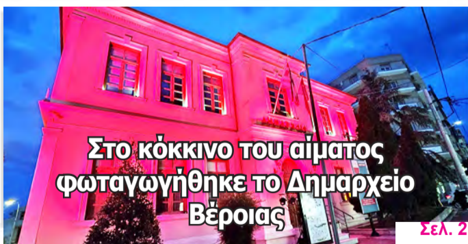
Στο κόκκινο του αίματος φωταγωγήθηκε το Δημαρχείο Βέροιας Σελ. 2