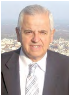
Γράφει ο Αναστάσιος Βασιιάδης

Μετά από μια περίοδο έντονων αγωνιών ολοκληρώθηκαν οι πανελλαδικές εξετάσεις που θα κρίνουν την μετάβαση από την δευτεροβάθμια στην τριτοβάθμια εκπαίδευση των αποφοίτων του Λυκείου, οι οποίοι βρέθηκαν στην κορύφωση της προσπάθειάς τους και προσδοκούν με αγωνία το ευτυχές αποτέλεσμα των κόπων τους.