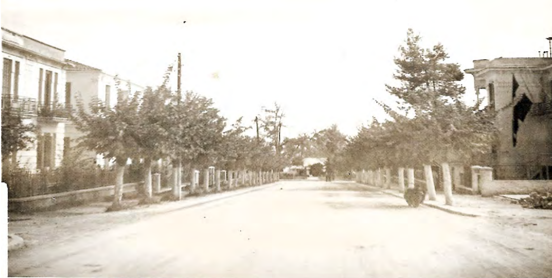
Λεωφόρος Έληας Βεροίας