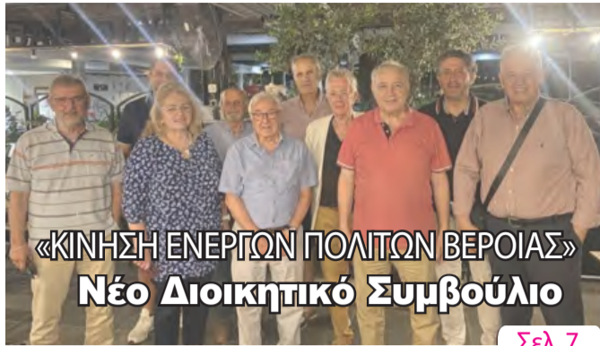
«ΚΙΝΗΣΗ ΕΝΕΡΓΩΝ ΠΟΛΙΤΩΝ ΒΕΡΟΙΑΣ» Νέο Διοικητικό Συμβούλιο