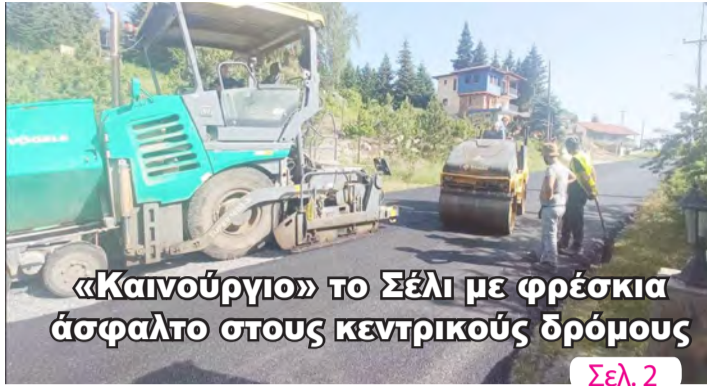
«Καινούργιο» το Σέλι με φρέσκια ασφαλτο στους κεντρικούς δρόμους