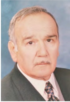
Γράφει ο Θωμάς Γαβριηλίδης