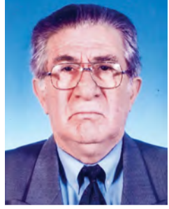
Γράφει ο Παναγιώτης Παπαδόπουλος Φιλολόγος

Ο Τάκιτος, δημοσιογράφος της αρχαιότητας, επιμένει ότι η ιστορία αποκαλύπτει την αλήθεια και σιωπάζει στο ψεύδος. Δυστυχώς όμως την ιστορία τη γράφουν πάντα οι νικητές. Έτσι συνηθίσαμε να λέμε. Έχει πάντα το υποκειμενικό στοιχείο που απομακρύνει