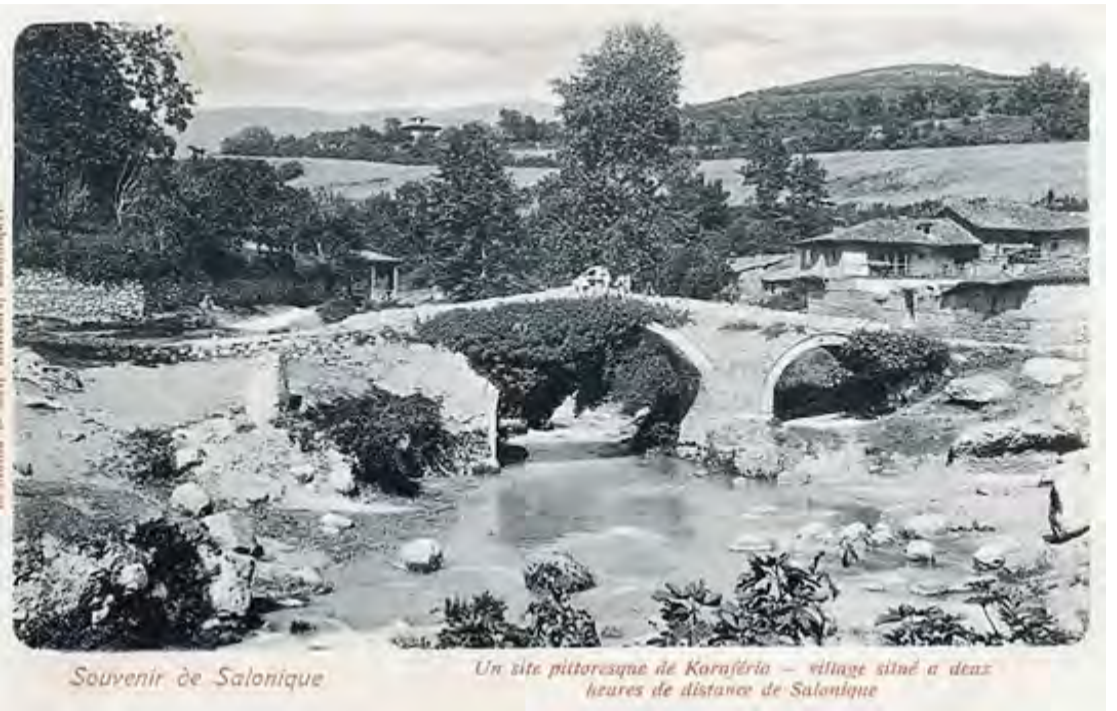
Souvenir de Salonique

Επιμέλεια: Στέργιος Ζυγουλιάνος – Συλλέκτης Φωτογραφιών