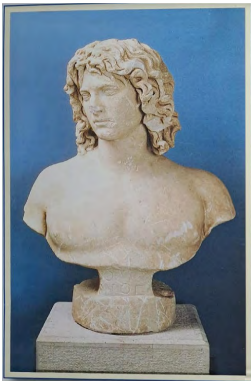
Ο ποτάμιος θεός Όλγανος

το όνομά του στο ποτάμι, που ίσως ταυτίζεται με το ποτάμι ΑΡΑΠΙΤΣΑ, που κατεβαίνει αφριστό από τη Νάουσα στον κάμπο κοντά στο χωριό Κοπανός. Μια προτομή του Όλγανου, που χρονολογείται στο δεύτερο αιώνα μ.Χ., εμπνευσμένη από τον τύπο του Αντίνοου, υπάρχει στο Μουσείο της Βέροιας. Αποκαλύφθηκε τυχαία στην περιοχή του Κοπανού, όπου ίσως υπήρχε ένα ιερό προς τιμήν του».