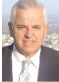
Γράφει ο Αναστάσιος Βασιάδης

Το γενικότερο ενδιαφέρον στρέφεται αυτήν την χρονική συγκυρία, στην δημοσιοποίηση του σχεδίου νόμου με τίτλο: «Εκλογή Ευρωβουλευτών/Διευκόλυνση Ψήφου Εκλογών- Εκκαθάριση Εκλογικών Καταλόγων και Λοιπές Διατάξεις», δια του οποίου προαναγγέλλεται η νομοθέτηση της επιστολικής ψήφου που προβλέπεται να ισχύσει στις προσεχείς ευρωεκλογές.