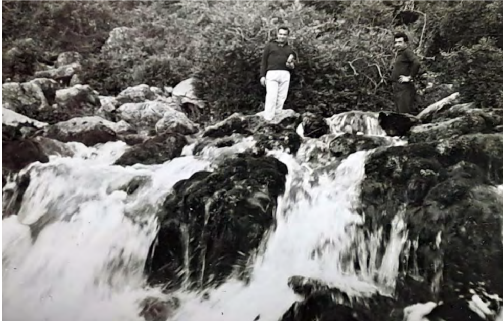
Η πηγή Αράπιτσα, 1963

2. Για πιθανή επίσης ταύτιση του ποταμού θεού Όλγανου με τον ποταμό Αράπιτσα της Νάουσας διάβασα, για δεύτερη φορά, στη σελίδα 8 (οκτώ) του βιβλίου «Λευκάδα-Αρχαία Μιέζα» (εκδ. Υπουργείου Πολιτισμού - Ταμείου Αρχαιολογικών πόρων και απαλλοτριώσεων - Αθήνα 1997) της αρχαιολόγου Κατερίνας Ρωμιοπούλου. Από το προαναφερθέν βιβλίο αντιγράφω τα εξής σχετικά με την ταύτιση Όλγανου-Αράπιτσας: «Σύμφωνα με τους τοπικούς μύθους, τα τρία τέκνα του μυθικού βασιλιά της περιοχής Βέρη, έδωσαν τα ονόματά τους, οι μεν κόρες του στις δύο σημαντικές πόλεις της Ημαθίας, Βέροια και Μιέζα, ενώ ο γιος του Όλγανος μεταμορφώθηκε σε ποτάμιο θεό και έδωσε