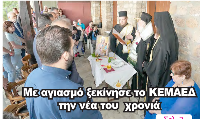
Με αγιασμό ξεκίνησε το ΚΕΜΑΕΔ την νέα του χρονιά

ΑΔΕΣΜΕΥΤΗ ΚΑΘΗΜΕΡΙΝΗ ΕΦΗΜΕΡΙΔΑ ΤΟΥ ΝΟΜΟΥ ΗΜΑΘΙΑΣ