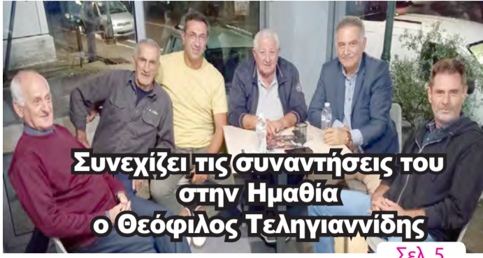
Συνεχίζει τις συναντήσεις του στην Ημαθία ο Θεόφιλος Τεληγιαννίδης