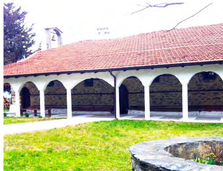
Παναγία - Ριζώματα

-Παλατίτσια Η εκκλησία του οικισμού αφι-