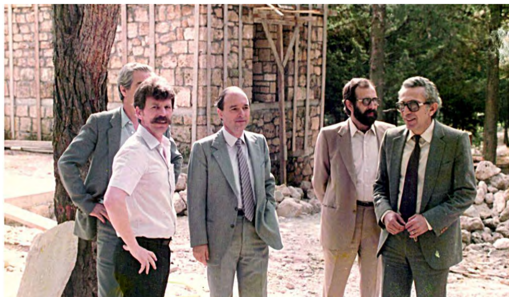
Εγκαίνια κατασκευών, πεζοδρόμων και καθιστικών στο άλσος Παπάγου από τον (τότε) υπουργό Γεωργίας Κώστα Σημίτη, Ιούνιος 1984.

Το 1983 εκπονήθηκε από τον καθηγητή Δασολογίας κ. Κων/νο Κασσιούμη η μελέτη «Οργάνωση του δάσους Παπάγου Δήμου Βέροιας για σκοπούς αναψυχής». Η μελέτη πρότεινε τη δημιουργία δικτύου μονοπατιών και σημείων θέας, τοποθέτηση στεγαστρών και κρηνών, πρόταση που υλοποιήθηκε σε βάθος χρόνου σε μεγάλο βαθμό, με τη συνεργασία του Υπουργείου Γεωργίας, του Δήμου Βέροιας και του Δασαρχείου.