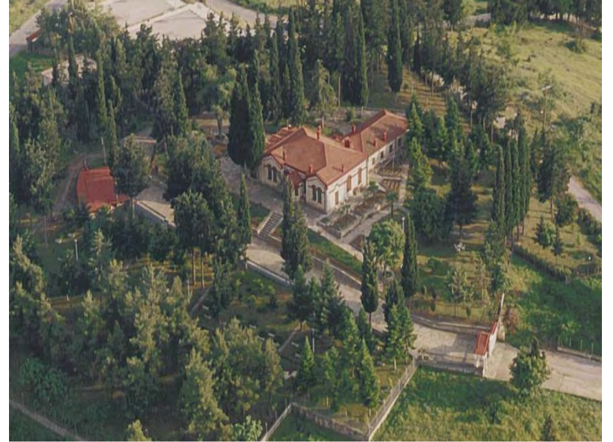
Η βίλα Βικέλα και μέρος του ομώνυμου πλέον άλσους στα 1984