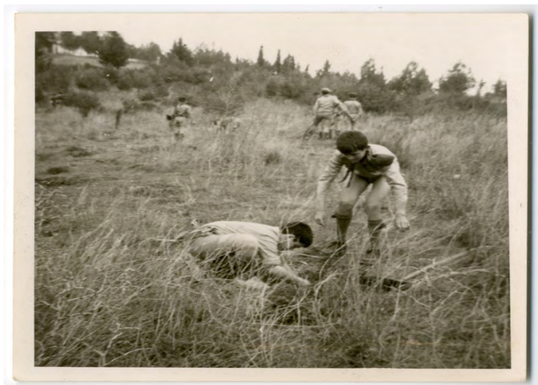
Δενδροφύτευση προσκόπων στον λόφο του Προφήτη Ηλία στα 1960

Οι κόπτοι όλων αυτών των «αλλοπαρμένων» που έκαναν πράξη την αγάπη τους για τη φύση, πέραν της καθημερινής βιοτικής ωφέλειας, χάρισαν σε όλους εμάς τους νεότερους μοναδικές κι αλησμόνητες στιγμές!!! Αλήθεια, ποιος δεν έχει κάτι όμορφο να θυμάται από τα άλση της πόλης μας;