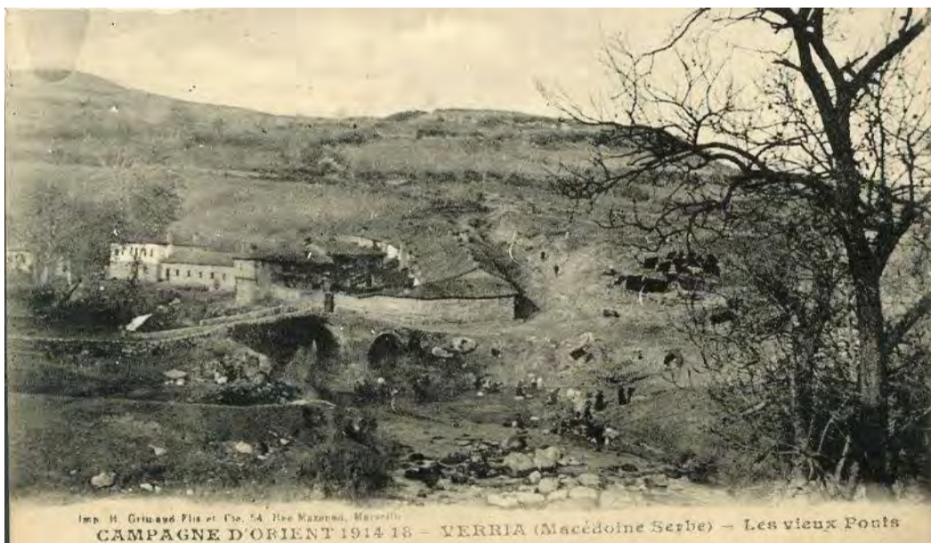
Imp. H. Orléans et Cie. 54 Rue Mazard, Marseille CAMPAGNE D'ORIENT 1914-18 - VERRIA (Macédoine Serbe) - Les vieux Ponts

Μεταξύ 1957-58, μια (ρομαντική θα την χαρακτηρίζα) πρωτοβουλία των περιοίκων κατοίκων του (τότε αποκαλούμενου "Καρσί Μπαϊλάρ") λόφου για την ανέγερση ενός εξωκκλησιού αφιερωμένου στον Προφήτη Ηλία, παρακίνησε σε αθρόες προσφορές δωρεών σε γη και χρήματα για την πραγμάτωση του έργου. Αποτέλεσμα ήταν η θεμελίωση του Ιερού Ναού στις 16 Ιουλίου 1958 και η μετονομασία του λόφου λίγες ημέρες αργότερα από το τότε Δημοτικό Συμβούλιο. Μόλις ένα χρόνο μετά, ολοκληρώθηκε η ανέγερσή του και το έργο συμπληρώθηκε με τη δενδροφύτευση των δωρισμένων εκτάσεων (περίπου 25 στρέμματα). Και πάλι οι προσκοπικές ομάδες της Βέροιας πρωτοστάτησαν στη φύτευση και προστασία των νεόφυτων δενδρυλλίων