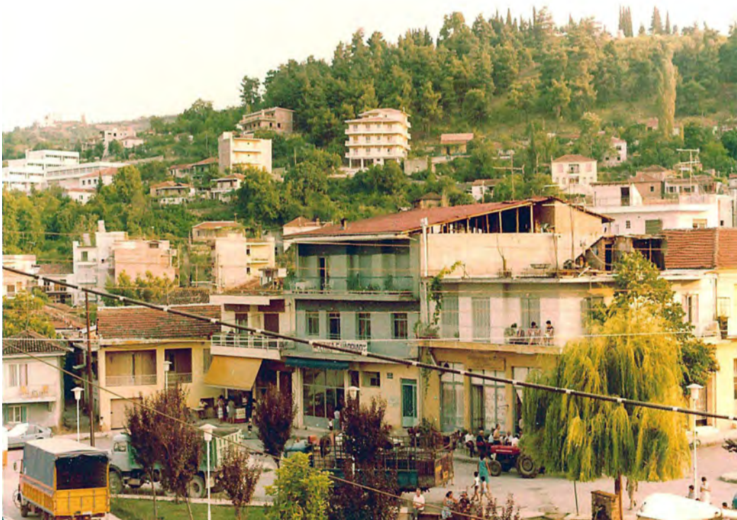
Στην κορυφή ο «λόφος των πεύκων», μετέπειτα άλσος Βικέλα