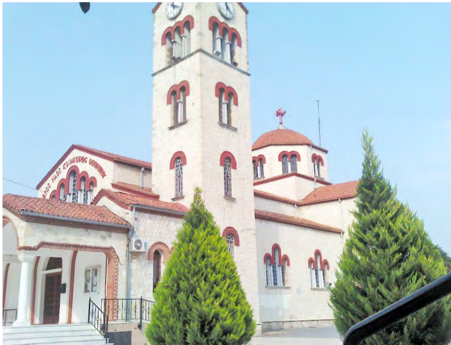
Κοίμηση Θεοτόκου - Αλεξάνδρεια

Οι τρεις μεγάλες πόλεις της Ημαθίας Βέροια-Νάουσα-Αλεξάνδρεια δεν μπορούσαν να μην «συμμετέχουν» σ' αυτή τη γιορτή της Παναγίας