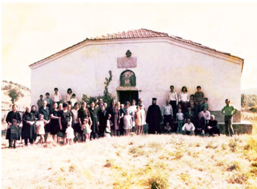
Παναγία - Χαράδρα (παλιά)

οδο του πανηγυριού για μέρες οι κάτοικοι γλεντούσαν στα σπίτια και χόρευαν στο «μεσοχώρι» του οικισμού.