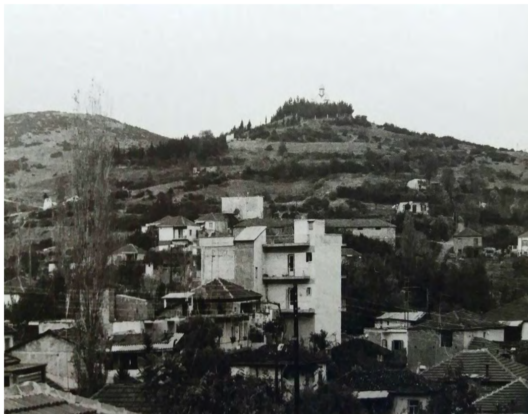
Το άλσος Προφήτη Ηλία τη δεκαετία του 1970.