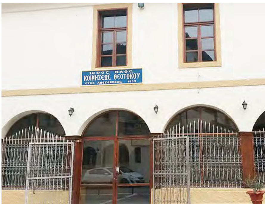
Κοίμηση Θεοτόκου - Νάουσα

-Στη Βέροια των 48 βυζαντινών και μεταβυζαντινών εκκλησιών αλλά