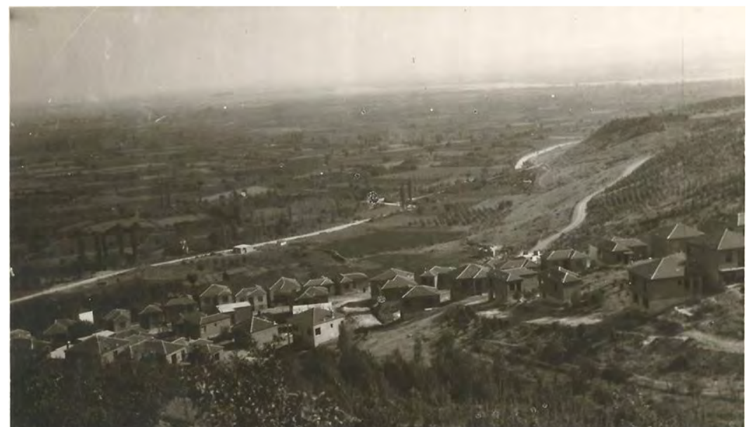
Ο συνοικισμός Παπάγου. Δεξιά το νεόφυτο Άλσος