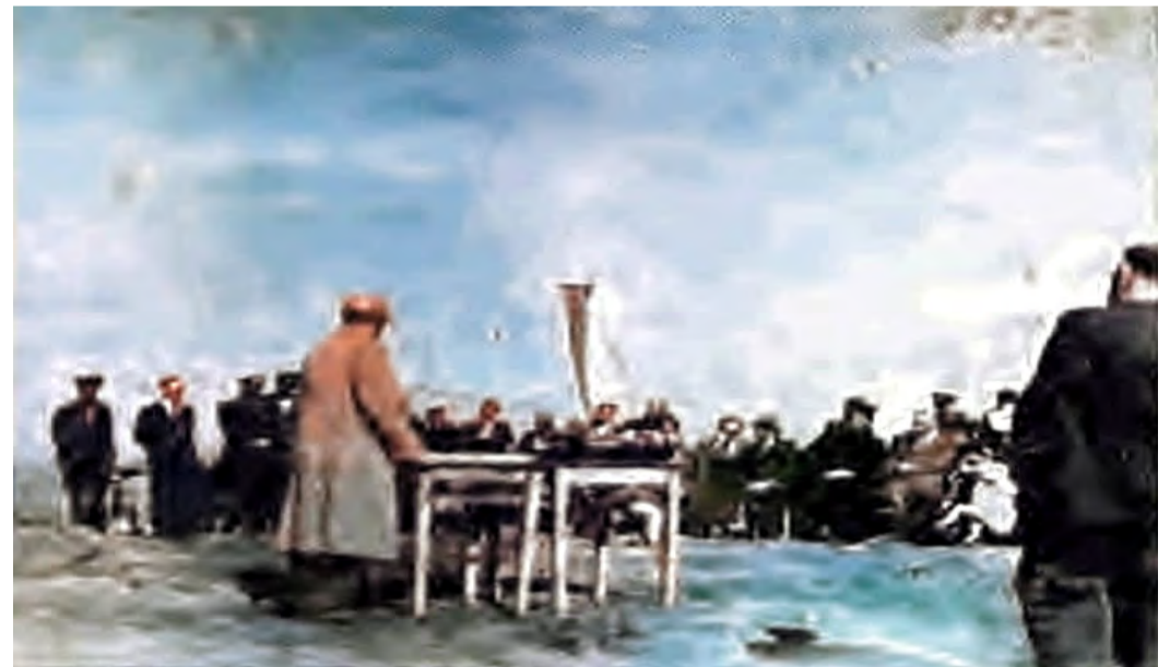
Η τελετή εγκαινίων του άλσους Παπάγου. Φωτογραφία του τύπου της εποχής