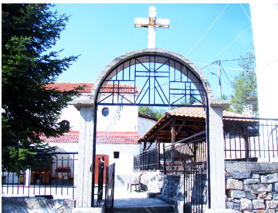
Παναγία - Σέλι

Κοντά στον οικισμό του Κάτω Βερμίου υπάρχει το εξωκλήσι της «Παναγίας της Σελιώτισσας»,