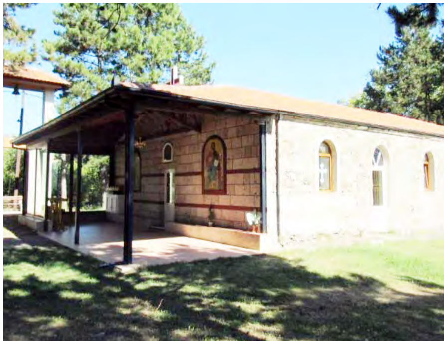
Παναγία - Χαράδρα