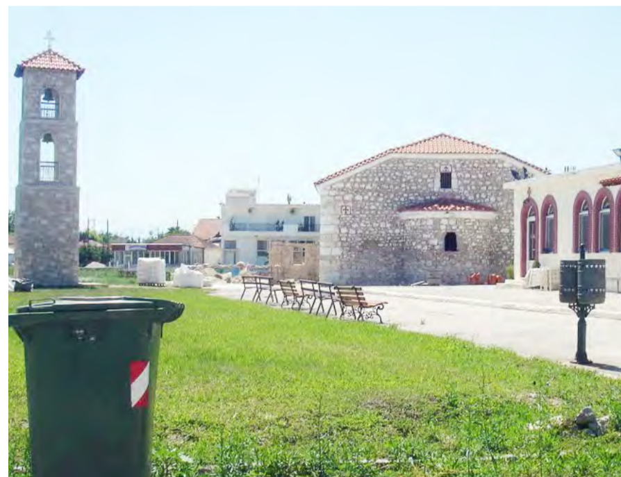
Παναγία - Κλειδί

-Βρυσάκι Η εκκλησία της Κοίμησης της Θεοτό-