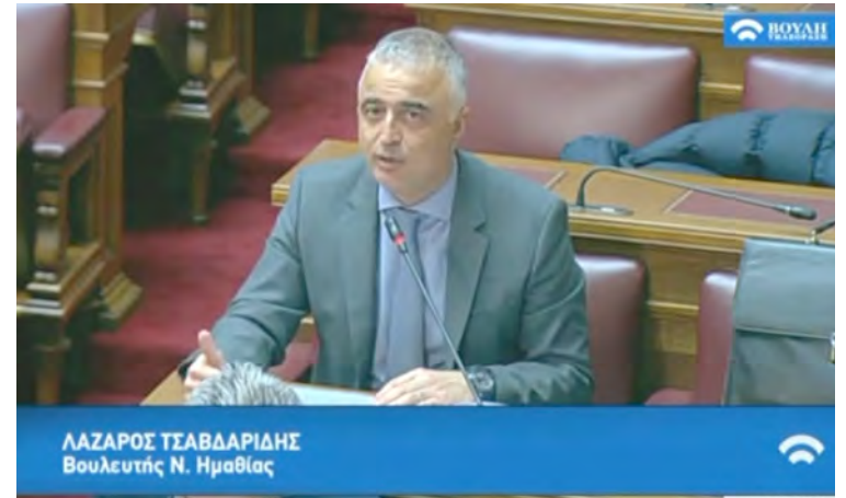
ΛΑΖΑΡΟΣ ΤΣΑΒΔΑΡΙΔΗΣ Βουλευτής Ν. Ημαθίας

Όπως εξάλλου χαρακτηριστικά επισήμανε κλείνοντας την τοποθέτησή του, «Οι απόδομοί μας, απαιτούν να τους αντιμετωπίσουμε ως ισότιμους πολίτες. Ως Έλληνες της διασποράς με τα ίδια συνταγματικά δικαιώματα και όχι ως διάσπαρτους Έλληνες που ζητούμε σε κάθε εκλογική αναμέτρηση την υποχρεωτική συνάθροισή τους στα εκλογικά τμήματα της χώρας ως σιωπηλή τιμωρία για την αποδήμησή τους. Οι απόδομοί μας απαιτούν να μην τους θυμόμαστε ως ισότιμους πολίτες μόνο αλά καρτ. Ο απόδομός μας απαιτεί, δανειζόμενος έναν αγαπημένο στίχο από ποντιακό