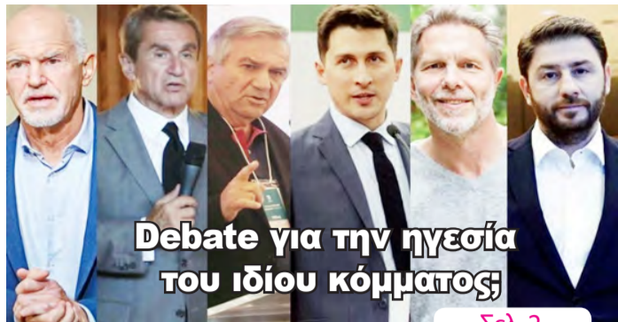
Debate για την ηγεσία του ίδιου κόμματος;