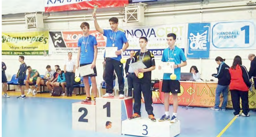
ΟΕΑ Βέροιας την αντιπεριφέρεια Ημαθίας τον ΚΑΠΑ του Δήμου Βέροιας στις 27 και 28 Νοεμβρίου, στο Φιλίππειο.

Το ανοιχτό Πανελλήνιο πρωτάθλημα Βέροιας στη μνήμη του αθλητή Φώτη Τσιαλιζούδη διοργανώνει η Τοπική Επιτροπή Βέροιας Ελλάδας της Ε.Φ.Ο.Επ.Α. σε συνεργασία με τον ΑΣΕΑ Βέροιας και τον