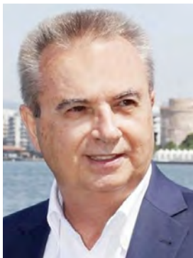
Μπορεί, το Κίνημα Αλλαγής, να γίνει πρωταγωνιστής; Του Γιάννη Μαγκριώτη