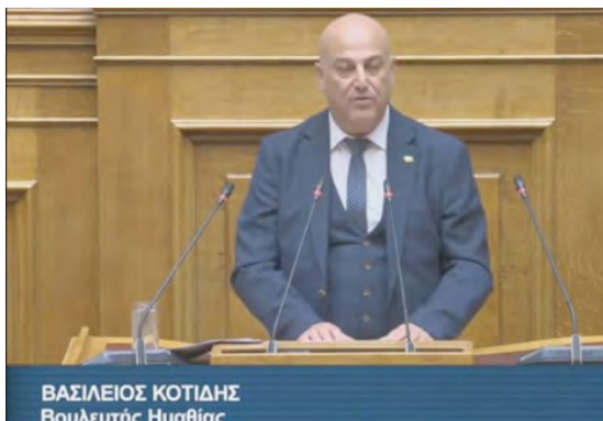
ΒΑΣΙΛΕΙΟΣ ΚΟΤΙΔΗΣ Βουλευτής Ημαθίας

Σημειώνεται ότι κατ' έτος χαράσσεται συγκεκριμένη δημοσιονομική πολιτική από την οποία προκύπτουν και οι θέσεις των εντασσόμενων μόνιμων υπηρετούντων στο Δημόσιο.