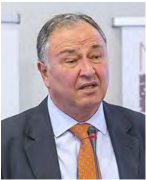
Του Κώστα Κιλτίδη

Στην σύγχρονη εποχή, των ανοικτών κοινωνιών και κρατών εντός ενώσεων και συμμαχιών, η έννοια της ασφάλειας των πολιτών, έχει πολυεπίπεδα και πολυπαραγοντικά γνωρίσματα. Το ανθρώπινο δικαίωμα της ζωής διευρύνεται ως έννοια πέραν των περιουσιακών στοιχείων. Η εργασία, η στέγη, η περιθαλψη και ακόμη η σίτιση, οδηγούν διαρκώς σε κατάσταση ανασφάλειας τον πολίτη, συμπαρασύροντας και την κοι-