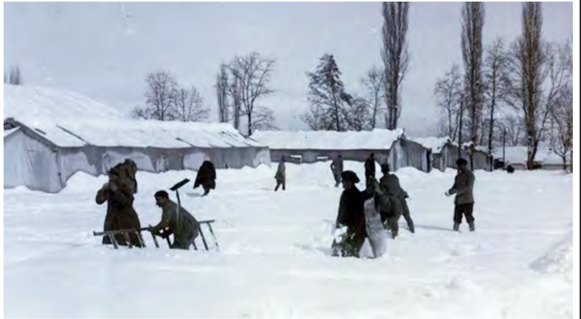
Χειμώνας του 1918. Στρατώνες κάτω από το χιόνι. Στρατιώτες στο χιόνι για εργασίες αλλά και για παιχνίδι.