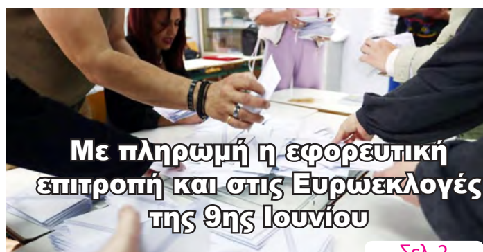
Με πληρωμή η εφορευτική επιτροπή και στις Ευρωεκλογές της 9ης Ιουνίου