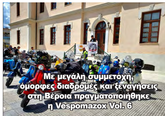
Με μεγάλη συμμετοχή, όμορφες διαδρομές και ξεναγήσεις στη Βέροια πραγματοποιήθηκε η Vespomazox Vol. 6

ΑΔΕΣΜΕΥΤΗ ΚΑΘΗΜΕΡΙΝΗ ΕΦΗΜΕΡΙΔΑ ΤΟΥ ΝΟΜΟΥ ΗΜΑΘΙΑΣ