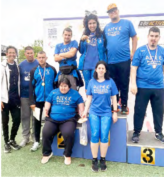
αποδείξουν για ακόμα μια φορά θλητισμός είναι για όλους. με την συμμετοχή τους ότι ο α-

Όπως κάθε χρόνο τα μεγάλα ονόματα του Παρά-Στίβου στη χώρα μας, θα δώσουν το «παρών» στη Θεσσαλονίκη διεκδικώντας τον τίτλο του πρωταθλητή και της πρωταθλήτριας Ελλάδος. Ανάμεσα στους αθλητές και στις αθλήτριες θα βρίσκεται και η 8μελής ομάδα μας όπου θα