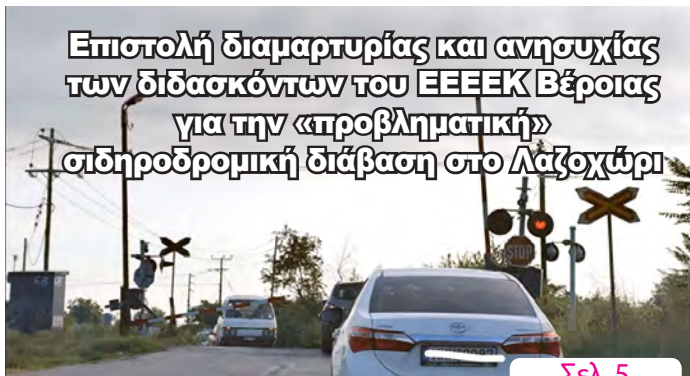
Επιστολή διαμαρτυρίας και ανησυχίας των διδασκόντων του ΕΕΕΕΚ Βέροιας για την «προβληματική» σιδηροδρομική διάβαση στο Λαζοχώρι